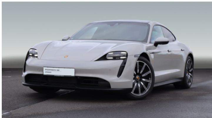
Porsche Zentrum Mainz