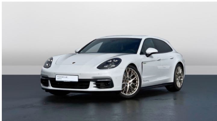
Porsche Zentrum Mainz