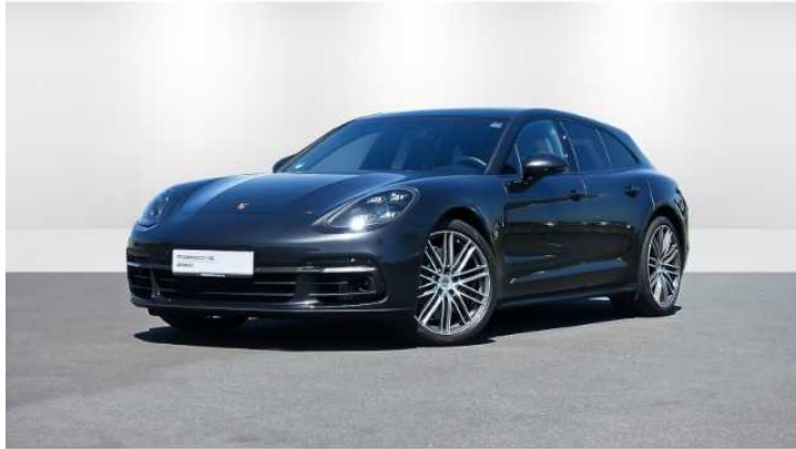
Porsche Zentrum Mainz